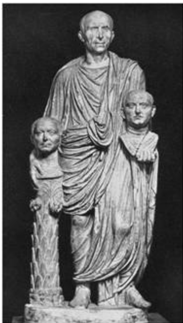
Статуя пожилого римлянина с портретами предков. Рим, Палаццо Барберини

Открытие нового строительного материала - бетона - дало новые конструктивные возможности строительства гигантских зданий и сводчатых перекрытий (по словам французского историка архитектуры О. Шуази, "этруски дали римлянам арку, Греция - ордера"). Здание, построенное из кирпича на римском бетоне, снаружи облицовывалось мрамором или камнем. В культовом зодчестве римляне использовали либо тип греческого периптера, по-этрuscoски модифицируя его в псевдопериптер (располагали его на высоком подиуме с лестницей и делали углубленный портик, а колонны храма превращали в полуколонны, не имеющие конструктивного значения, да и круглые колонны постепенно теряли свою несущую функцию, оставаясь чистой декорацией), либо тип ротонды - круглого в плане храма, окруженного со всех сторон колоннами, как, например, храм на Бычьем рынке в Риме с 10-метровыми коринфскими колоннами (I в. до н.э.).