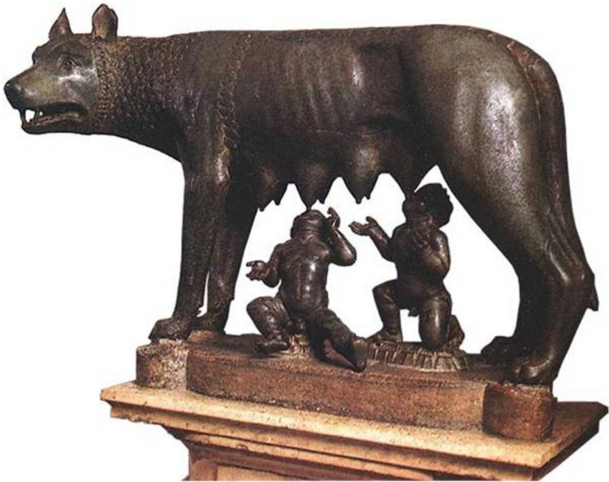
Волчица с Капитолия. V в. до н. э. Рим, Музей Капитолия. Превосходная техника бронзового литья говорят о том, что это работа этрусских мастеров.